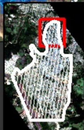
COBIJA UBICACION DE AREA AFECTADA